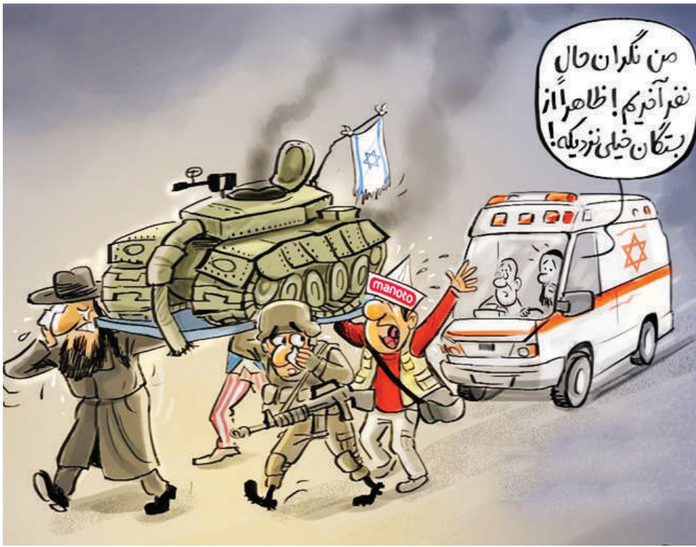
عزادری شبکه من‌وتو برای صهیونیست‌ها