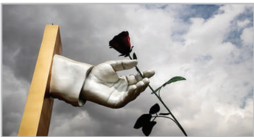
رونمایی از تندیس دست مهر به یاد حاج قاسم سلیمانی