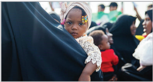
در حاشیه استقبال از شیخ ابراهیم زک‌زکی - تهران