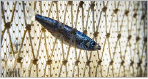
صید کیلکا - دریای خزر