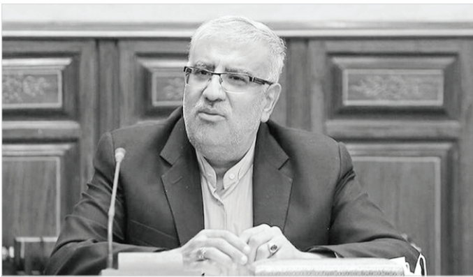
ذخایر غنسی هیدروکربوری دارند، گفت: از همین رو دو کشور، از ظرفیت‌های خوبی برای

وزیر نفت با اشاره به اینکه ایران و روسیه