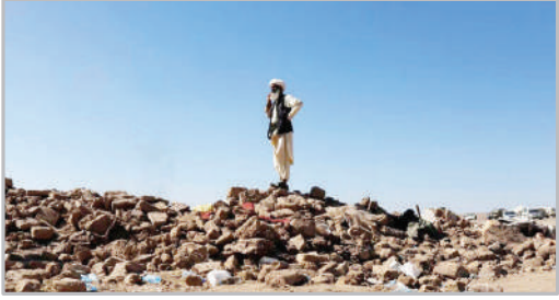
زلزله در هرات - افغانستان